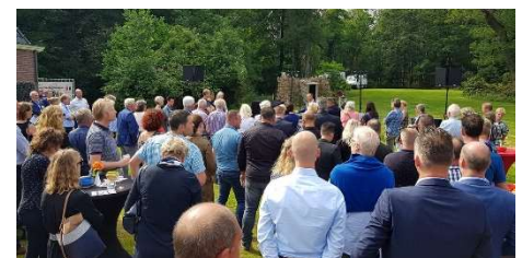
Netwerkbijeenkomst Haringparty