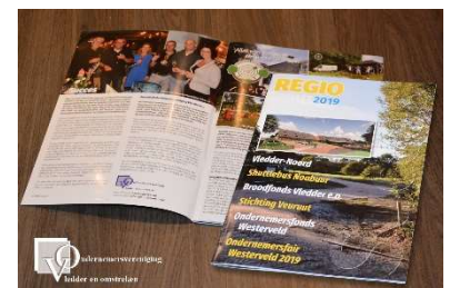
Ondernemersmagazine Vledder e.o.