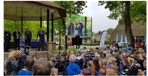
Opening Science Hub