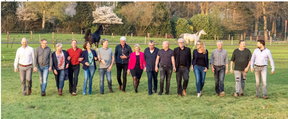
Bestuur en fondsmanager Ondernemersfonds Westerveld en bestuur Koepel Ondernemend Westerveld

De penningmeester krijgt financieel-administratieve ondersteuning van een betaalde inhuurkracht op oproepbasis, niet in loondienst.