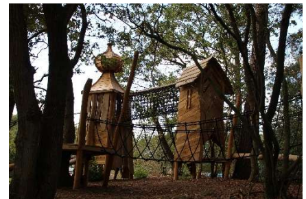
Beleefpark Dwingeloo